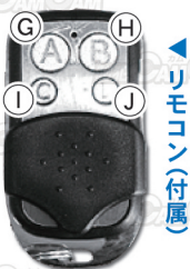
▲ リモコン (付属)